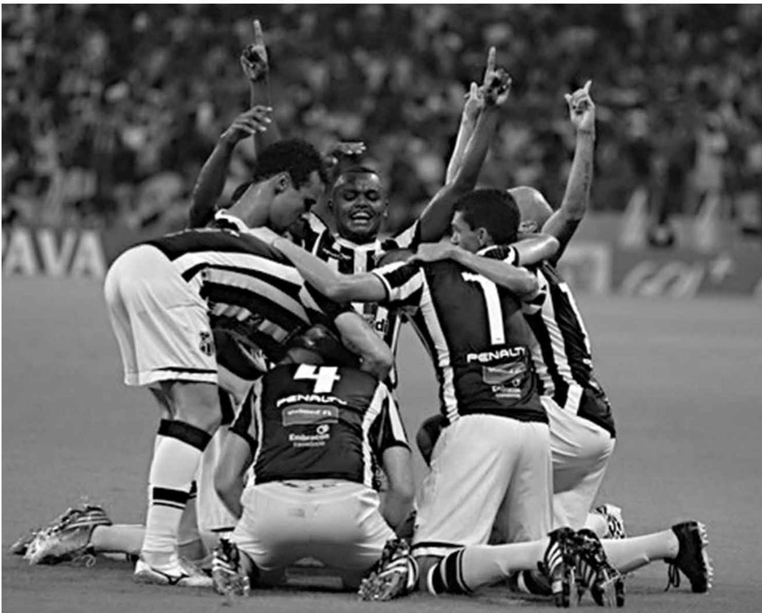
No gramado do Castelão os jogadores comemoram o segundo gol e a vitória que garantiu o Ceará na Copa Sul-Americana deste ano