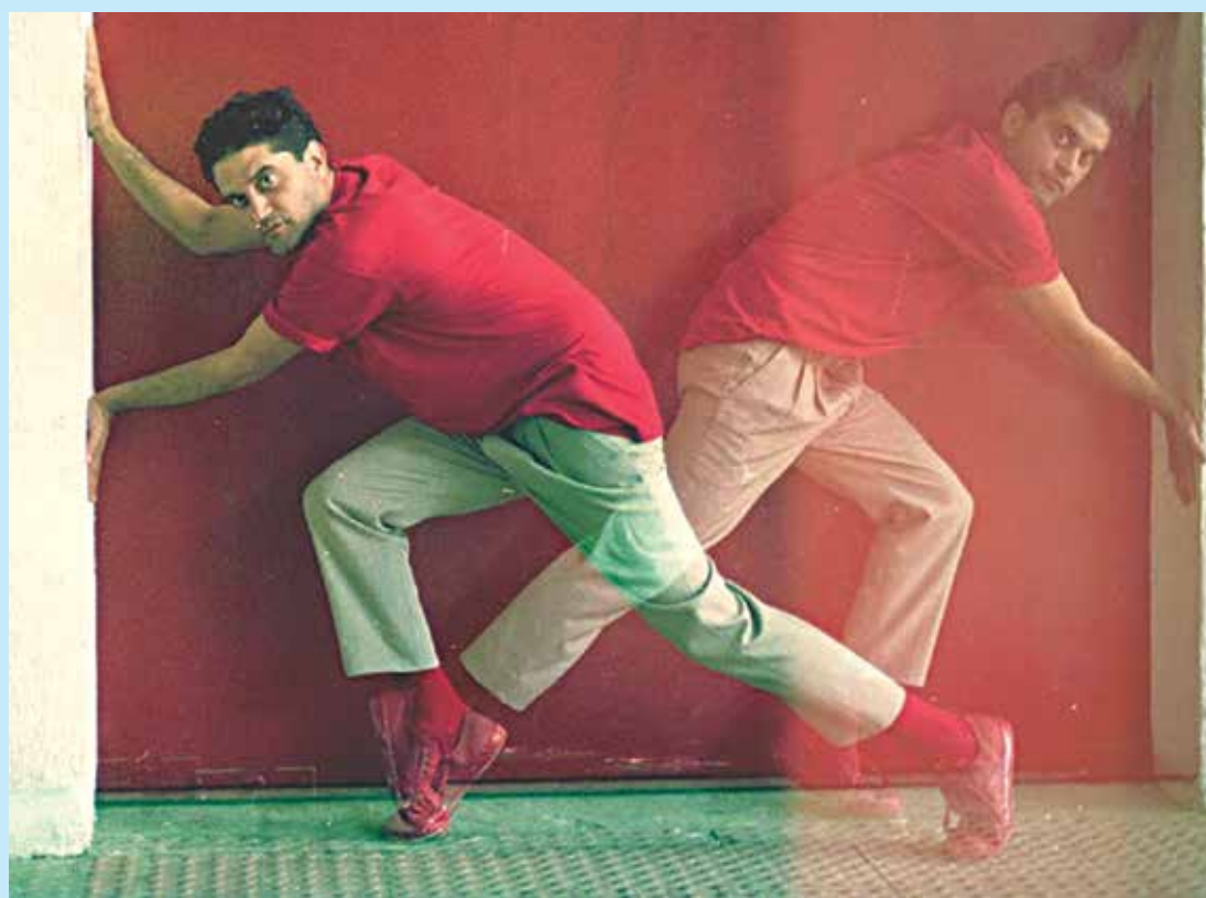
O pernambucano vai apresentar o seu novo trabalho produzido durante seis anos

Dentre as participações especiais está a cantora Céu, na faixa 'Filtre-me', como compositora e intérprete, numa