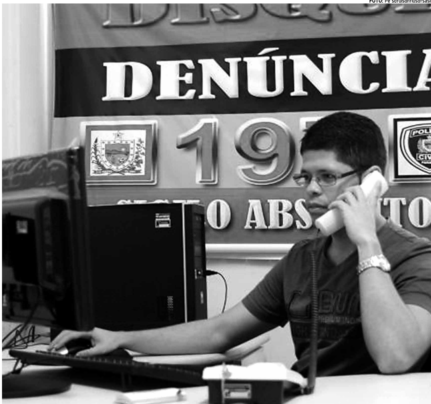
Nos primeiros quatro meses de 2015, o serviço já recebeu 1.549 denúncias, o que significa uma média de 12 ligações por dia

O crime foi investigado pelo Grupo de Operações Especiais (GOE), em parceria com o Núcleo de Inteligência