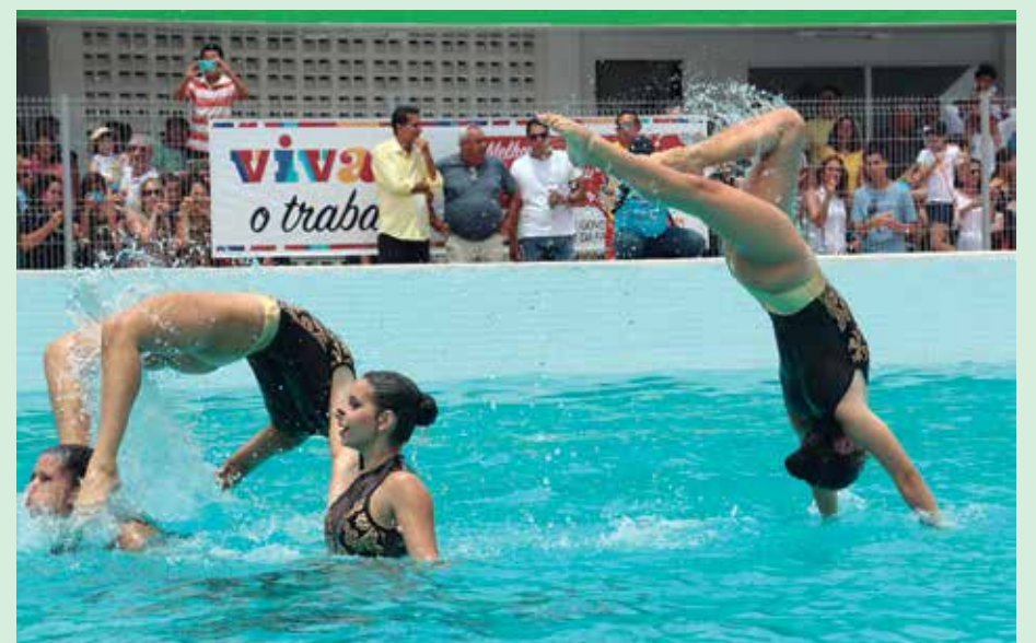
Atletas têm até o próximo dia 15 para fazer a inscrição no Programa Bolsa Atleta

A grande novidade para este ano é a inclusão de modalidades não olímpicas, que até então não vinham sendo contempladas pelo programa. Atualmente existem seis modalidades de bolsa atleta. A de rendimento internacional, destinada aos que tenham integrado a delegação brasileira nos últimos jogos olímpicos e paralímpicos; de rendimento nacional, que é para quem conquistou na competição máxima da temporada nacional, no ano anterior ao pleito, o primeiro, segundo ou terceiro lugar ou esteja em pri-