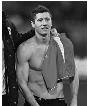
Lewandowski, do Bayern

Robert Lewandowski fraturou a mandíbula e o nariz e havia se tornado dúvida para o duelo contra o Barcelona. Segundo Karl-Heinz Rummenigge, chefe executivo do clube alemão, o atacante estará em campo na próxima quarta-feira, quando as duas equipes fazem o jogo de ida das semifinais da Liga dos Campeões. Em declarações à emissora de rádio B5 Aktuell, o 'Kaiser' explicou como o jogador deve participar da partida, apesar da grave lesão.