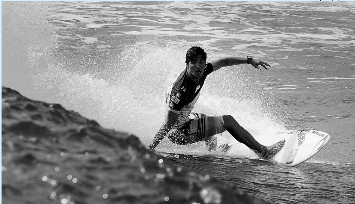
Medina não teve um bom início no Mundial de Surf e ocupa apenas o 16º lugar no ranking. A etapa do Rio começa no dia 11