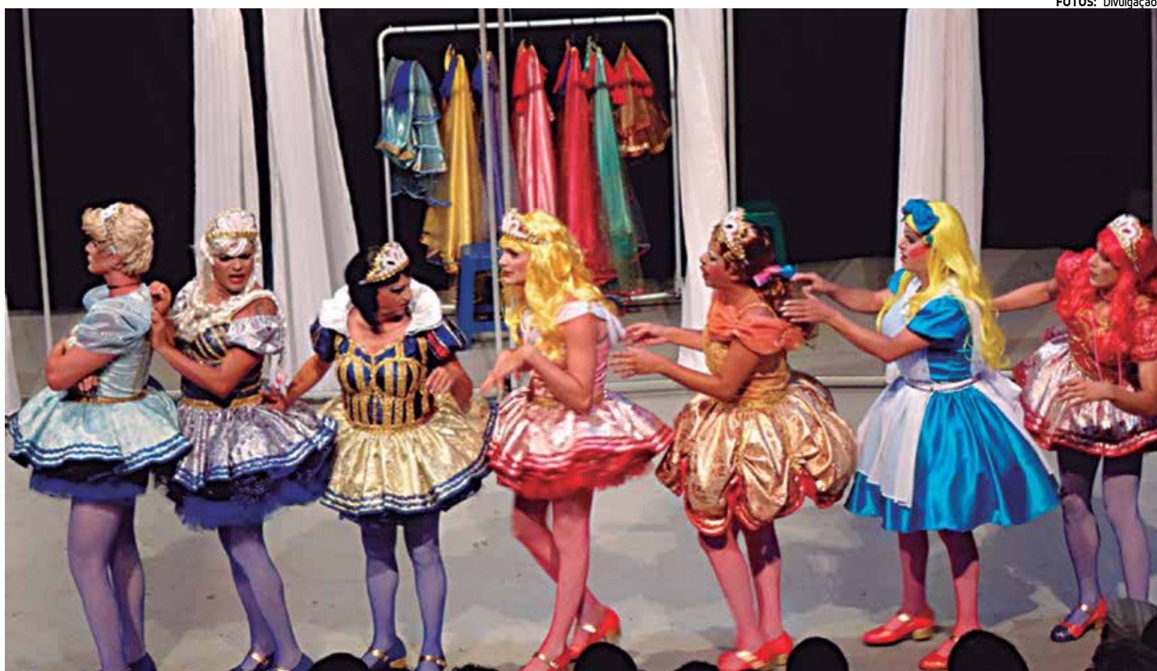
Grupo de teatro é reconhecido pelo humor escrachado, sempre abordando temas atuais, arrancando gargalhadas do público

Baseado nas histórias e contos das princesas dos filmes do norte-americano Walt Disney, Pastoril Profano em Avacalhando os Contos de Fadas – O Musical é apresentado ao longo de 80 minutos. A peça - cuja criação coletiva exigiu dos integrantes da Companhia Paraibana de Comédia um trabalho de pesquisa, leitura e modificação de narrativas - conta a história das personagens Biuzinha (Branca de Neve), Verinha (Bela), Ceicinha (Alice), Luzinete (Rapunzel), Dieht (Cinderela), a mudinha (Ariel) e Light (princesa Aurora), que - a pedido do Velho Dengoso, do Pastoril Profano - foram fazer um curso de teatro. No entanto, enquanto frequentam as aulas, elas resolvem encenar os enredos das princesas dos contos de fadas. Porém, por serem desastradas, metidas e exibidas, termina dando tudo errado, levando cada uma a entrar na história da outra, armando,