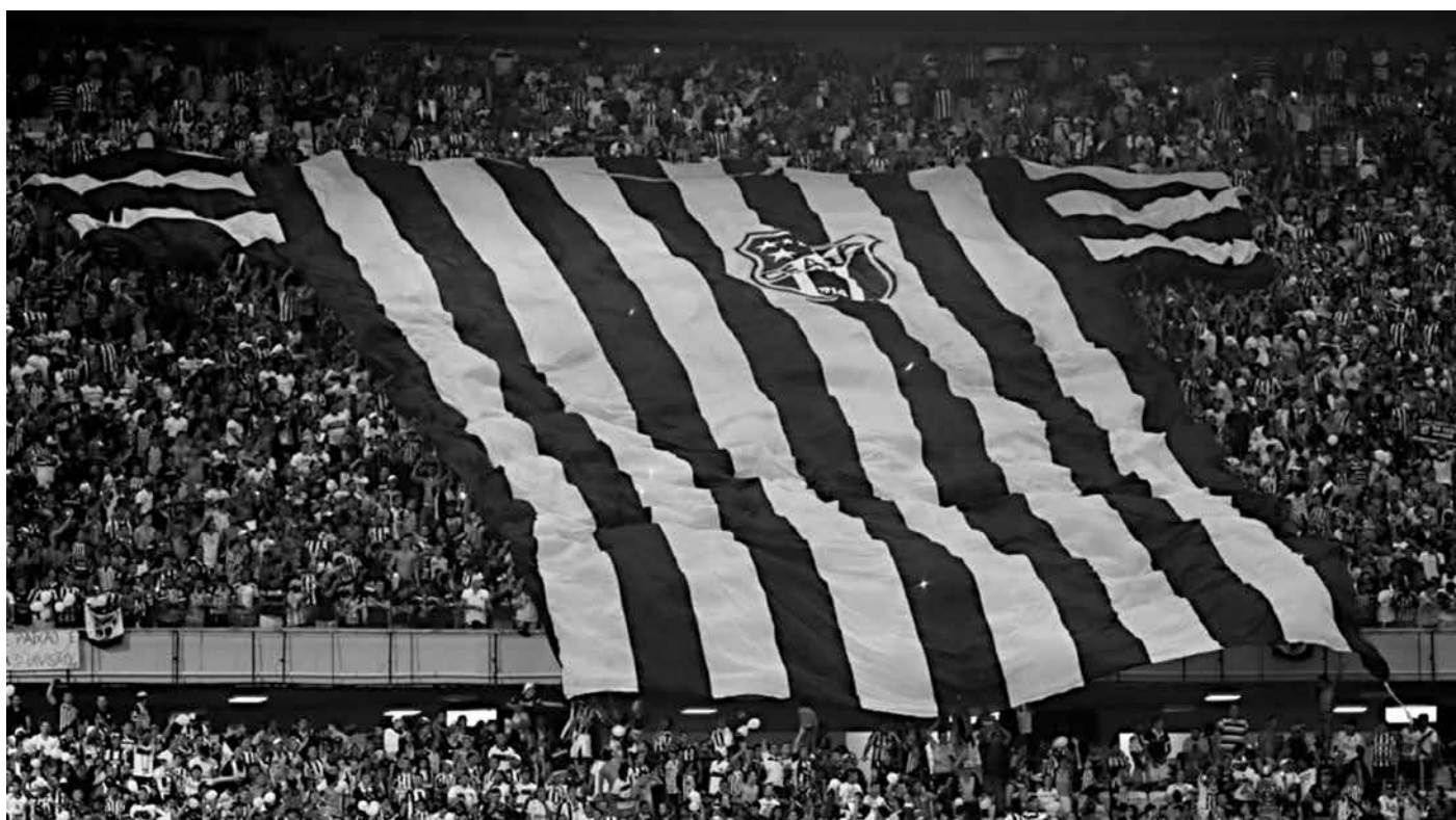
A torcida do Ceará fez uma grande festa no Estádio Castelão e vibrou com a conquista da Copa do Nordeste ao vencer o Bahia

O recorde do Ceará pode ser batido pela segunda partida da final do Carioca, entre Botafogo e Vasco, no próximo fim de semana. Com os 56.246 bilhetes (sem contar gratuidades e cortesias) vendidos antecipadamente e em menos de 24 horas, o estádio do Maracanã terá lotação máxima no clássico.