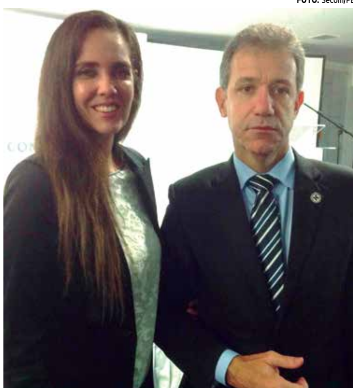
Secretária de Saúde da Paraíba Roberta Abath e o ministro da Saúde, Arthur Chioro