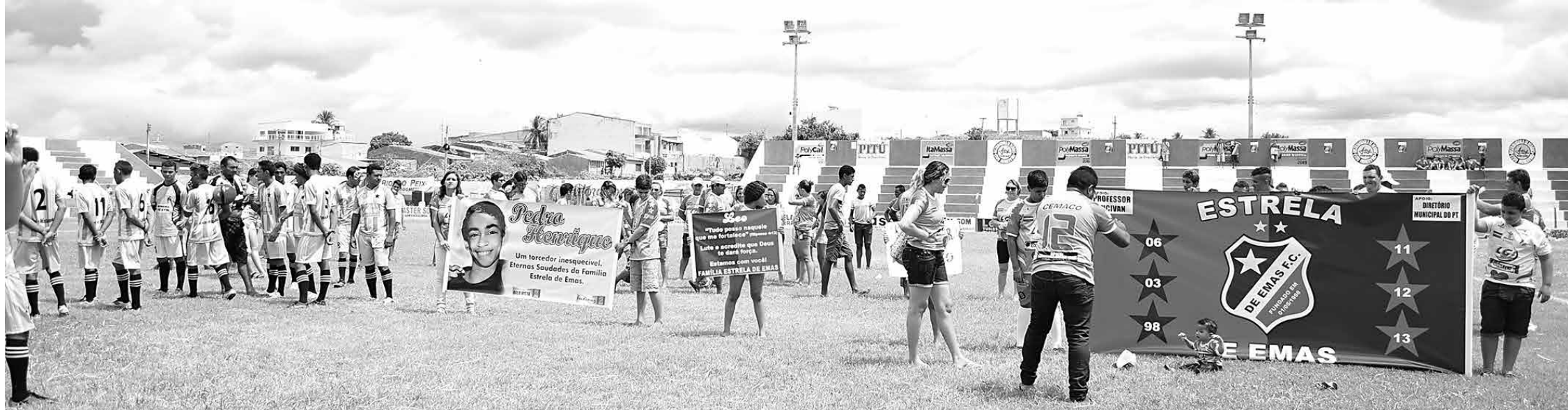
As equipes participam de um desfile no Estádio Zezão, que já foi palco de jogos pelo Campeonato Paraibano e em seguida começam as disputas e a expectativa é que 200 equipes estejam integradas