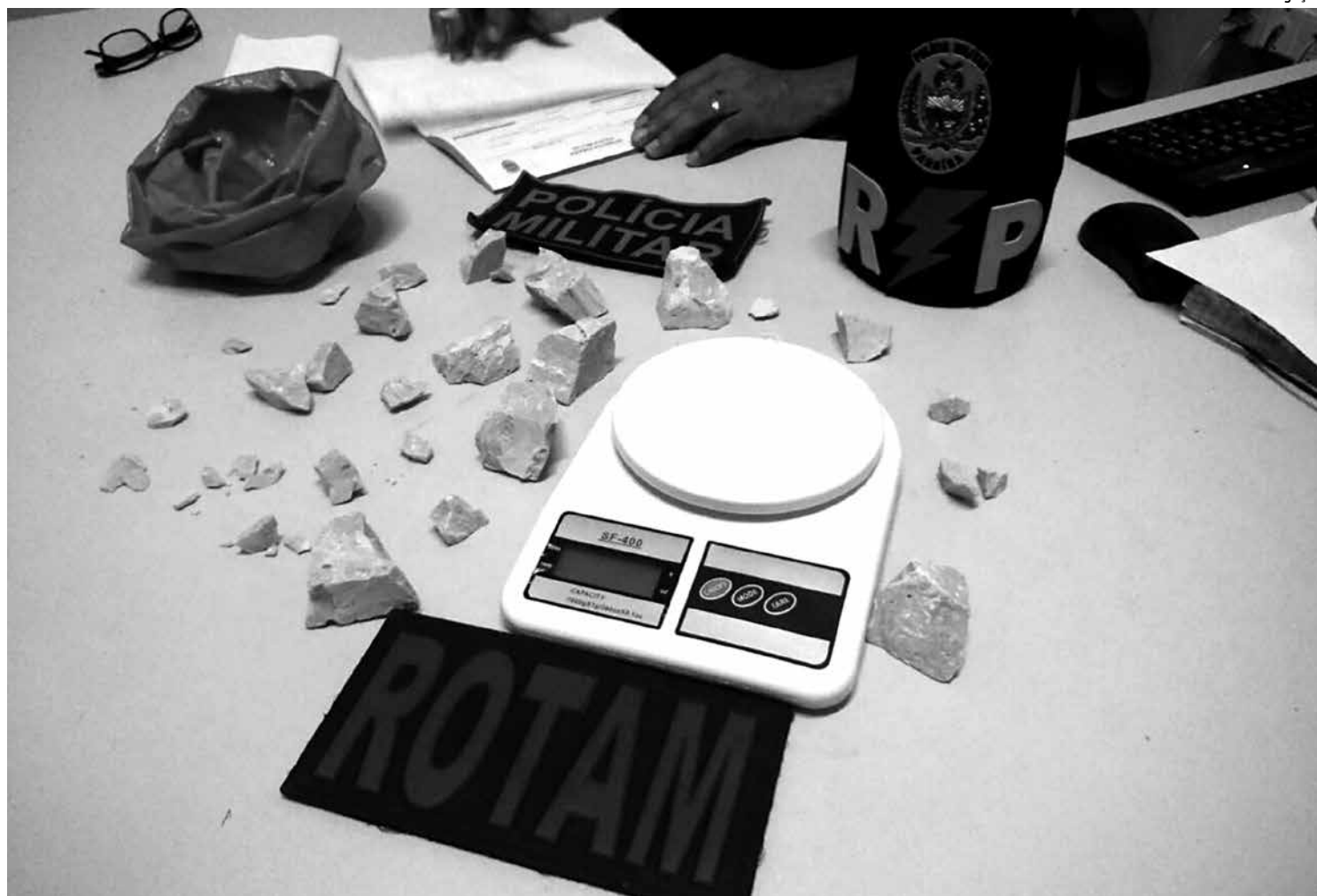
Policiais apreenderam maconha, cocaína e crack na noite da última quarta-feira nas cidades de João Pessoa, Campina e Guarabira

Um dos aparelhos estava com o rastreador ligado. Seguindo o rastreador, a polícia chegou até o bairro dos Novais, onde a esposa de um dos bandidos estava com o celular na mão e todos os objetos roubados foram encontrados dentro da casa. A mulher e os objetos foram encaminhados ao Distrito Integrado de Segurança Pública (Disp) de Manaíra. Os acusados pelo assalto não foram encontrados no local.