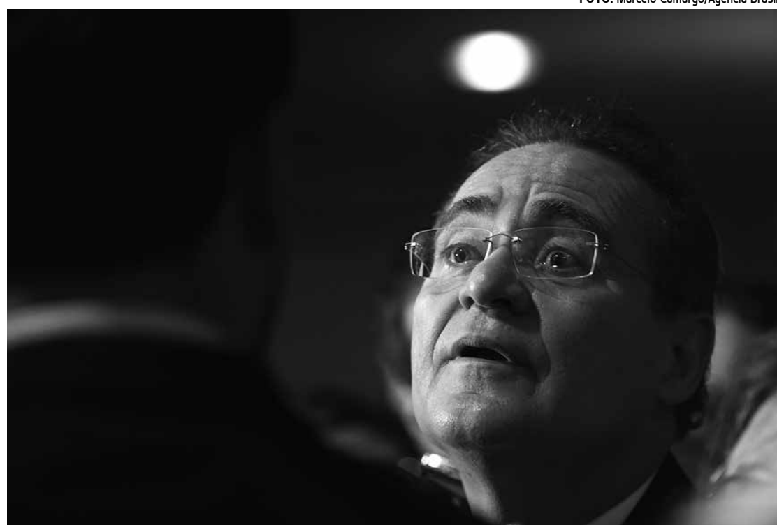
Renan Calheiros afirmou que o PMDB não se transforma em articulação de recursos humanos

A polícia vinha investigando o esquema desde 2013. De acordo com o delegado, os mentores do grupo criavam empresas fantasmas para obter empréstimos no BB.