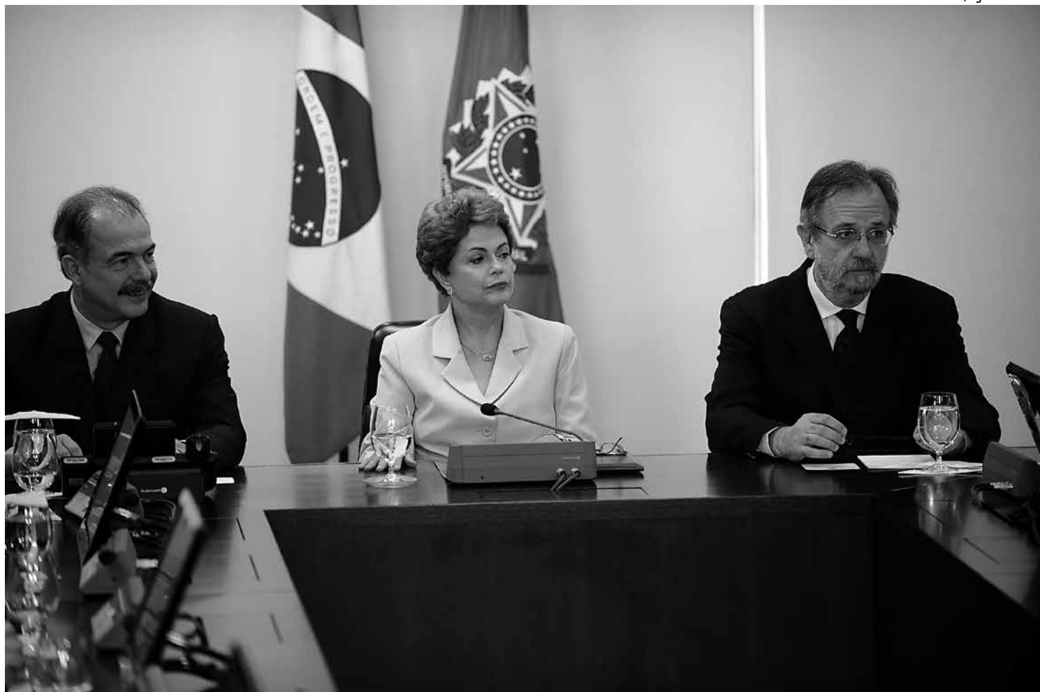
A presidente Dilma Rousseff se reuniu com representantes de centrais sindicais no Palácio do Planalto para discutir a terceirização

Na reunião, Dilma anunciou a criação do Fórum de Debates sobre Políticas de Trabalho, Renda, Emprego e Previdência formado por representantes de centrais sindicais, empresários, aposentados e pensionistas e governo. Ela explicou que a pauta do fórum terá seis itens: sustentabilidade do