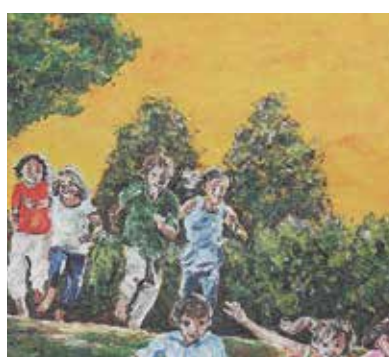
As obras retratam cenas do cotidiano infantil com um colorido que tem como marca a suavidade e a sensibilidade